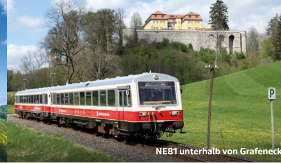
NE81 unterhalb von Grafeneck

6 SCHLOSS LICHTENSTEIN Auch bekannt als „Märchenschloss Württembergs“, da es in Baustil und Einrichtung die Romantik weiterleben lässt, ist dieses Schloss eine Huldigung an das Mittelalter. Angeregt durch den Roman „Lichtenstein“ von Wilhelm Hauff, wurde das Schloss im neugotischen Stil als weltweit einziges nach einer Romanvorlage erbaut. Zum Schlossgelände gehören der Gerobau, die Kapelle, ein weitläufiger Schlossgarten und der romantische Schlosshof. In den restaurierten Gemächern des Grafen Wilhelm von Württemberg zeigt sich die üppige Pracht der spätmantischen Wohnkultur.