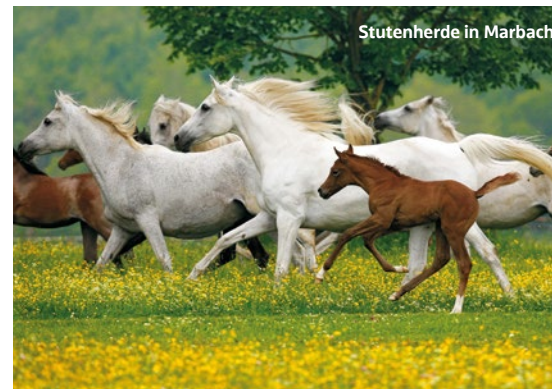
Stutenherde in Marbach

7 HAUPT- UND LANDGESTÜT MARBACH Im ältesten staatlichen Gestüt Deutschlands erfahren Pferdefans bei einem Rundgang viel Wissenswertes über Pferderassen, die Arbeit im Gestüt und dessen Geschichte. Mit dem historischen Triebwagen erreicht man den Bahnhof Marbach und könnte dort auch wieder die Rückfahrt antreten. Die drei historischen Gestütschöfe, die Hengstparaden, die Gestütsführungen und Stuten und Fohlen auf den Weiden ziehen viele Interessierte an. gestuet-marbach.de Gestütshof 1 | 72532 Gomadingen-Marbach Tel.: 07385 9695000